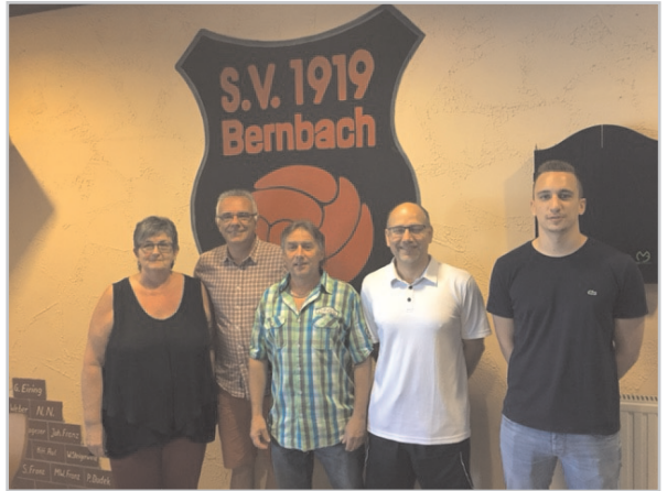
Vorstand SV 1919 Bernbach e.V.